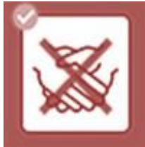
Kein Händeschütteln. Wenn möglich, nichts berühren.