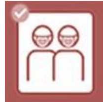
Maskenpflicht für 12-15 Jährige