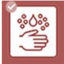
Hände waschen/ desinfizieren