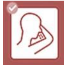
Niessen/Husten bitte in Armbeugen.